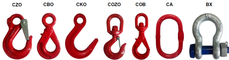
Tabela udźwignów zawiesia węzowego 3-cięgnowego