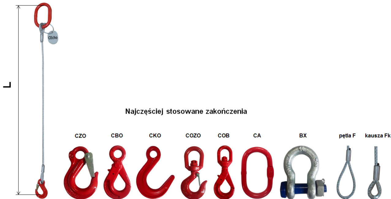
Tabela udźwignięć zawiesia linowego 1-cięgnowego