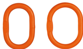
Tabela udźwignięcia zawiesia łańcuchowego 1-pętlowe (klasa 10)