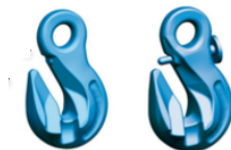
Tabela udźwignów zawiesia łańcuchowego 1-pętlowego w kl. 12